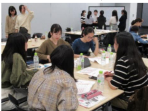
ワークショップ風景②