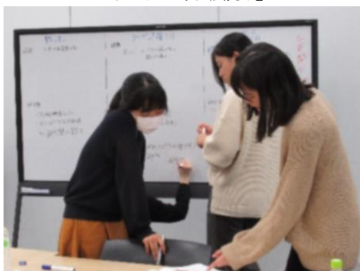
ワークショップ風景①