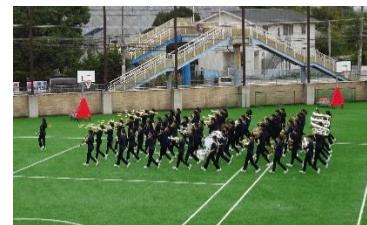
吹奏楽部マーチング公演