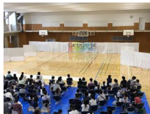
新体操部大体育館公演