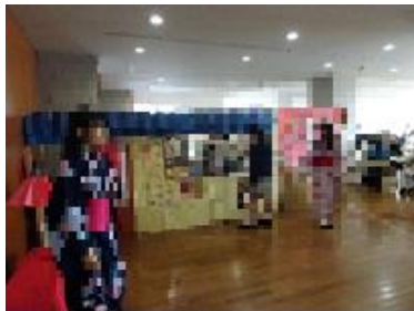
クラスによる飲食販売

父親の会 Fathers' の有志のお父様によるお好み焼きやかき氷の販売も、例年の通り大盛況でした。