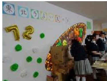
洗足祭実行委員会による東北物産展