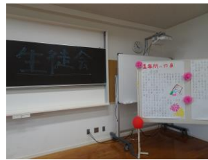
生徒会による学校紹介