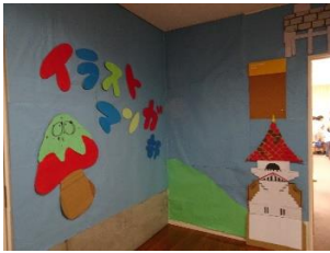
イラストマンガ部

中学1年生・2年生は学年ごと、中学3年生・高校1年生はクラスごとに展示をおこないます。その他、部活動や生徒会のブースも、充実した展示を見ることが出来ます。