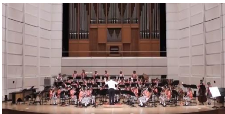
吹奏楽部 前田ホール公演

吹奏楽部や新体操部、ダンス部など、文化祭にふさわしい華やかなステージが繰り広げられます。中高の大講堂や、大学の前田ホール、そして何とグラウンドでも！目や音で楽しむことが出来ます。